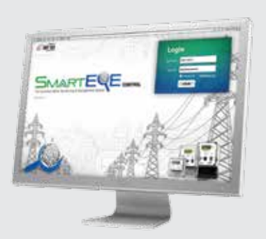
Smart Eye Control