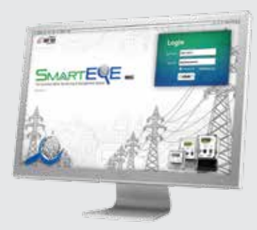
Smart Eye Desk