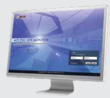
PDC Live Monitor