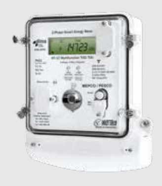
3-Phase LT/HT Meters