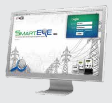
Smart Eye MDC