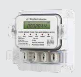
Single Phase Meters