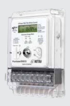
3-Phase Whole Current Meters